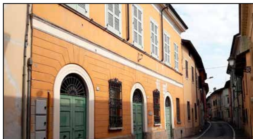
Ex biblioteca in via XXV Aprile.

Da tempo abbiamo suggerito una soluzione che potrebbe