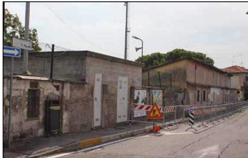
Il muro pericolante di via Turati.

L'intervento viene a costare circa 100.000 euro che vengono utilizzati dalla somma degli 800.000 euro previsti per la ristrutturazione dell'ex bibliote-