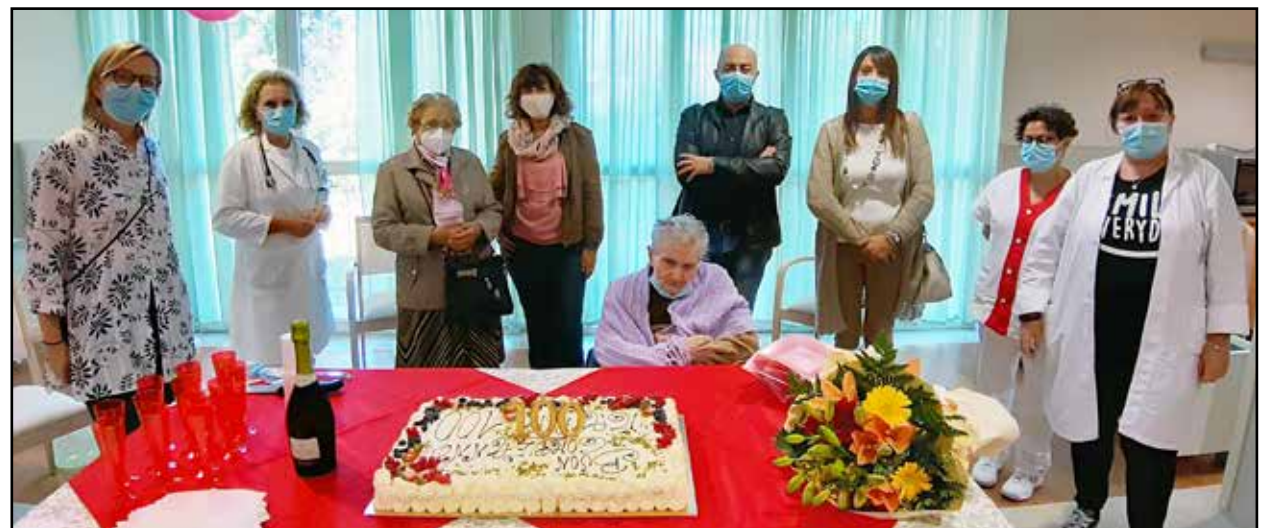
La festeggiata con gli amministratori, dirigenti e parenti.