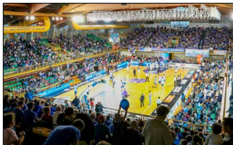
Il Palageorge, fiore all'occhiello per Montichiari.

Si veniva da una brillante gestione, a dir poco, dell'era