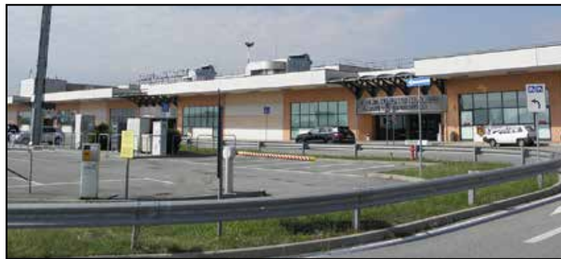
L'aeroporto di Montichiari.

le più lunghe d'Italia e si può usufruire da entrambe le direzioni. Sfatato il dubbio della nebbia, ormai inesistente, l'aeroporto aveva tutte le caratteristiche di prendere una bella fetta di utenti, ma la brescianità nella sua completezza, politica ed economia, ha preferito ancora rivolgersi al "vicino" aeroporto di Bergamo.