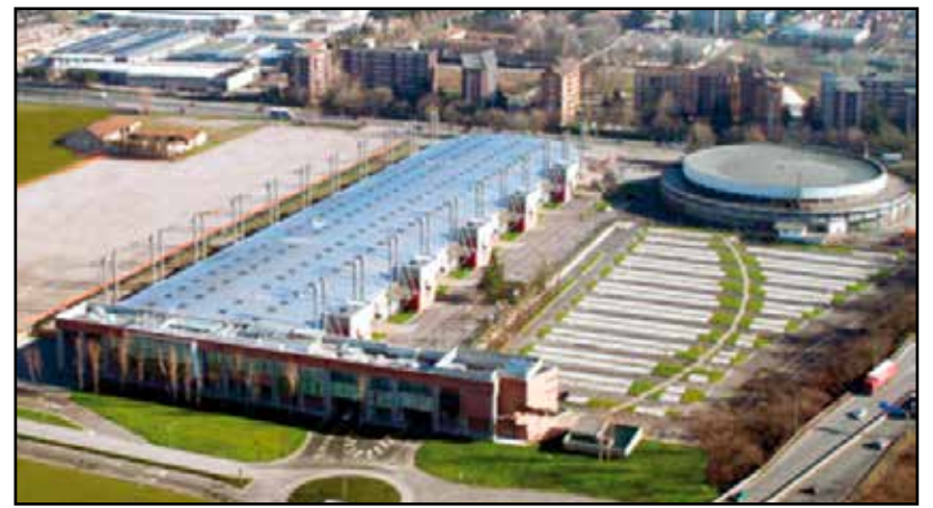
Fiera di Brescia: un grande spreco di denaro pubblico.