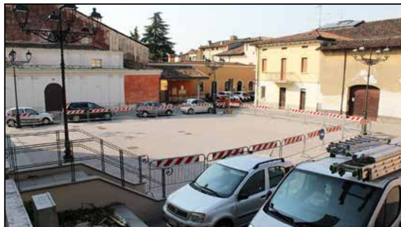
La piazza Teatro che ospiterà il Mercato Contadino.

I termini dell'accordo sono: proroga dell'attuale convenzione per altri sei mesi, allacciamenti alla corrente elettrica, con la clausola di valutare